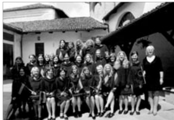
Vilniaus universiteto merginų choras VIRGO

G.B.Pergolesi, V.Abrici, M.K.Čiurlionio, G.Caccini ir kitų autorių kūriniai